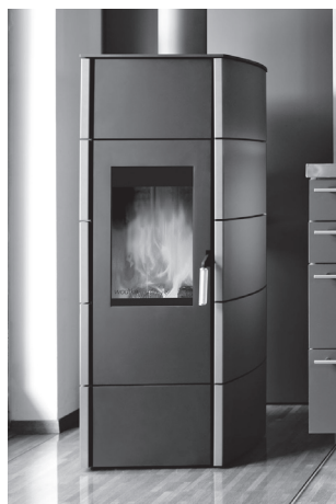
Focus Open 2009